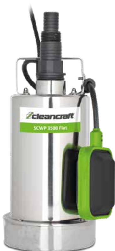
SCWP 3508 FLAT