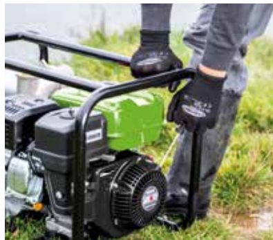
Motore a 4 tempi con avviamento manuale