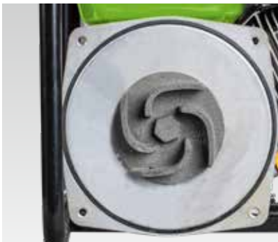
Robusta, durevole e affidabile: elica e ventola in ghisa