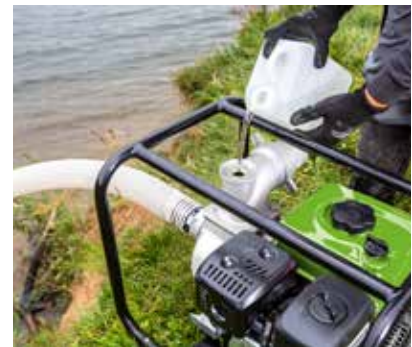
Facile da utilizzare: è semplice generare pressione negativa